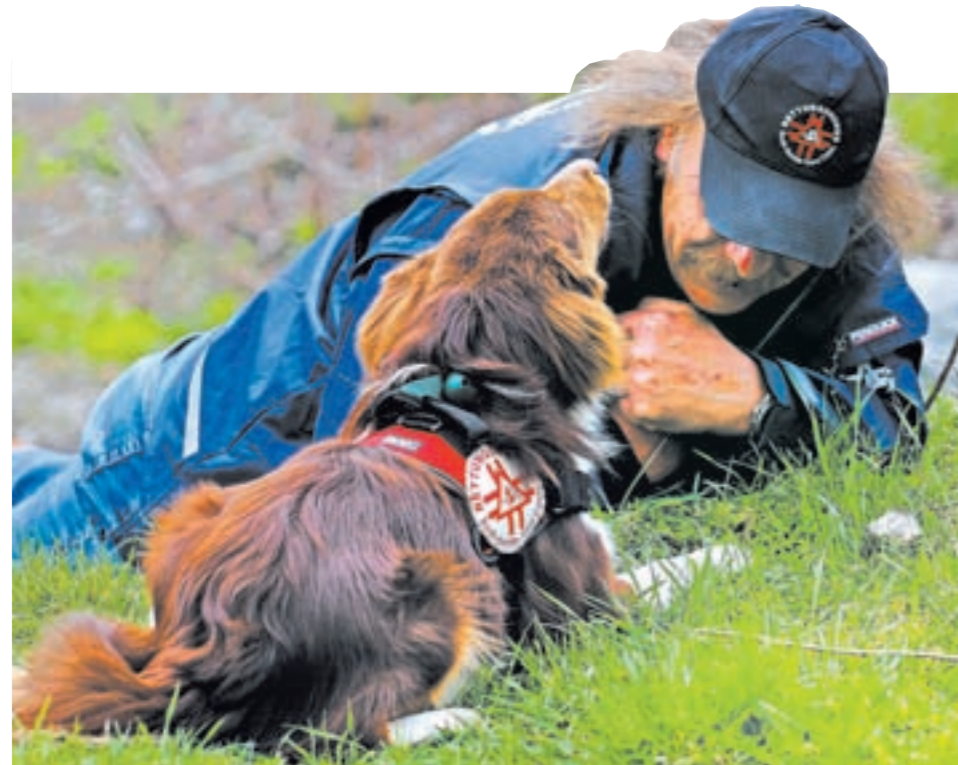
Suchhund Coda legt sich vor das Opfer und bellt, sobald sie es entdeckt hat. So wissen ihre Führer, dass sie jemanden gefunden hat.

Mit 700 Euro und einem Handy ist ein Unbekannter am Donnerstag aus einem Privathaus in Mutters verschwunden. Der Dieb hatte sich vermutlich über eine unversperrte Terrassentür ins Wohnzimmer geschlichen.