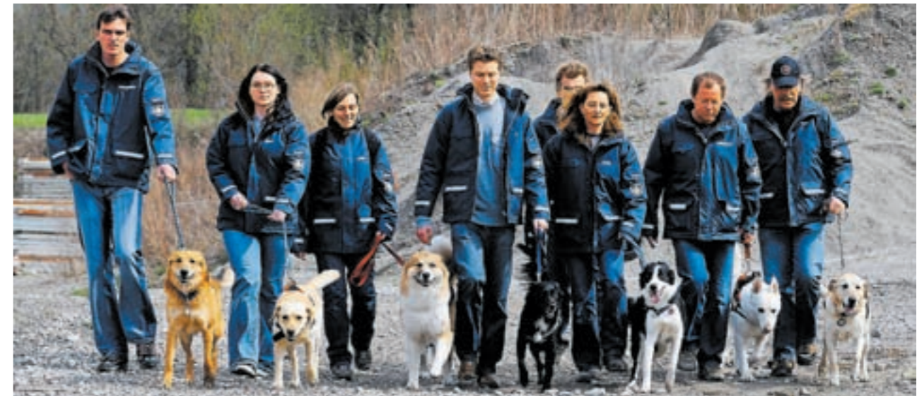
Die Hundeführer der Suchhundestaffel Tirol machen sich auf den Weg zu einer Suchübung.